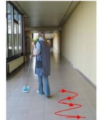
Vloer moppen in s-vorm